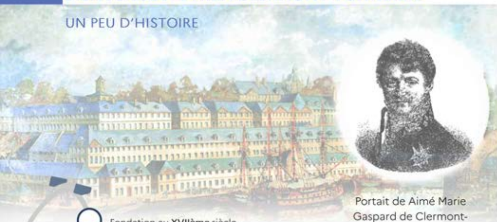
Portrait de Aimé Marie Gaspard de Clermont-Tonnerre